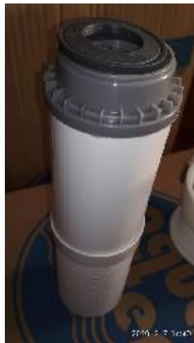
6. ábra - a szűrőbetét tömítése helytelenül behelyezve

A szűrőbetétet ezután be kell áztatni kb. 1-2 órára egy edény hideg csapvízbe, úgy, hogy végig teljesen víz alá kerüljön. A betétre ehhez valamilyen nehezéket kell tenni, mert magától csak úszik a vízben és nem merül alá. Erre azért van szükség, hogy a betét felső, PP része teljesen feltöltődjön vízzel. Így összeszereléskor a készülékhez megfelelően visszahelyezhető a helyére és nem fog szivárogni a víz a tömítésnél a készülékből. Ez a művelet bár sok időt vesz el, de nem tanácsos kihagyni!