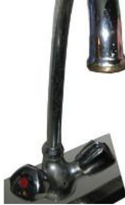
18. ábra - hagyományos külső menetes csaptelep

Ez a fajta hagyományos külső menetes csap a 18. ábrán látható. A felszereléshez csomagoljuk ki a fehér cső végén található szelepet és tekerjük ki a végéből a betétet (21. ábra). Erre a kitekert betétre a továbbiakban nem lesz szükségünk ennél a csaptípusnál, de érdemes megőrizni.