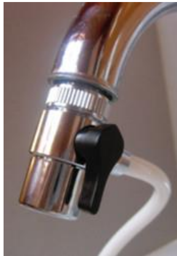
28. ábra - a csap használata

A konyhai vízszűrő használata a szelep megfelelő beállításából és a vízcsap megnyitásából áll. Amennyiben a csapból szeretne szűretlen vizet, állítsa a szelepet az 28. ábra szerinti pozícióba. Ekkor a víz a szűrőn nem halad át, hanem közvetlenül átfolyik a szelepen, így szűretlen csapvizet kap. Ebben az állásban tetszőlegesen forró vizet engedhet át a szelepen anélkül, hogy az a szűrőt károsítaná. Amennyiben szűrt vízre van szüksége, állítsa a szelepet az 29. ábra szerinti pozícióba. Ekkor a víz a szűrőn halad át, és a szűrő kifolyójából fog távozni a tisztított víz, a csapból ilyenkor nem folyik semmi. Ebben az állásban 45 Celsius fokos víznél ne engedjen melegebbet a készülékbe, mert károsodhat a szűrőbetét.