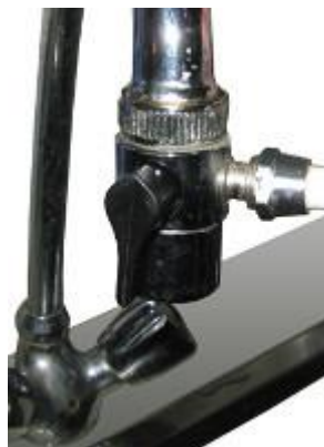
20. ábra - megfelelően felszerelt szelep

A szelep tartalmaz egy gumitömítést, ez maradjon a helyén, így tömítéssel együtt a konyhai csap végére a 19-20. ábra szerint egyszerűen tekerjük fel a