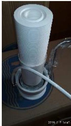
9. ábra - szűrőbetét behelyezése