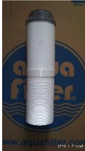
8. ábra - szűrőbetét