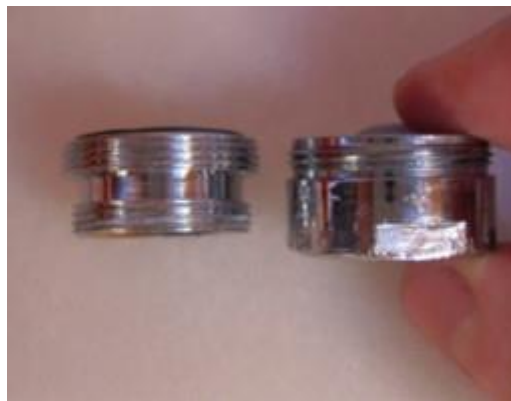
24. ábra - a betét és a perlátor

Előfordulhat, hogy a csapban található tömítést el kell távolítani ahhoz, hogy a betét betekerhető legyen. Ez nem probléma, mert a betétnek saját, beépített tömítése van. Lehetséges, hogy a csap annyira el van vízkövesedve, hogy a betét betekeréséhez előbb meg kell tisztítani vízkőoldóval.