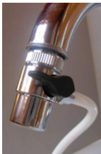
29. ábra - a szűrő használata