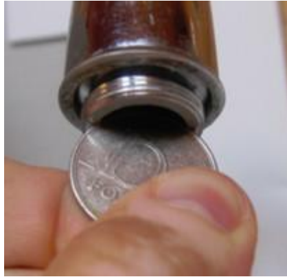
25. ábra - a betét megszorítása

A betétet a 10 Ft-os érmével alaposan meg kell húzni, hogy a betét és a csap közti tömítés működni tudjon és a víz később majd ne szivároгjon. Ezután már a betét szabadon maradt menetes végére rá lehet tekerni a szelepet (26. ábra).