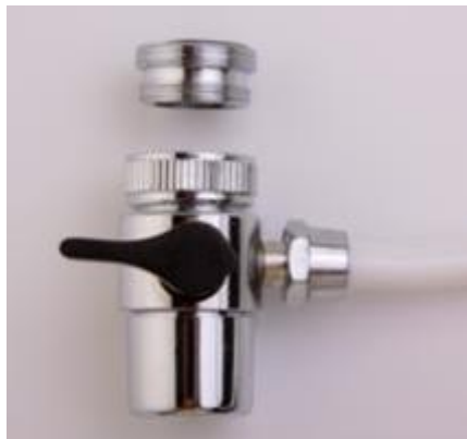
21. ábra - a kicsomagolt szelep a kitekert betéttel

Ez a fajta ún. perlátoros (vízporlasztós) csap a kifolyó végén található perlátorról (vízporlasztó) ismerhető meg. A csap vége az 22. ábrán látható. A felszereléshez csomagoljuk ki a fehér cső végén található szelepet és tekerjük ki a végéből a betétet. Az 21. ábra tetején látható a betét, alatta pedig a szelep.