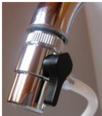
27. ábra - a felszerelt szelep

A szelep felszerelésével a szűrőbetét készen áll a bejáratásra (27. ábra).