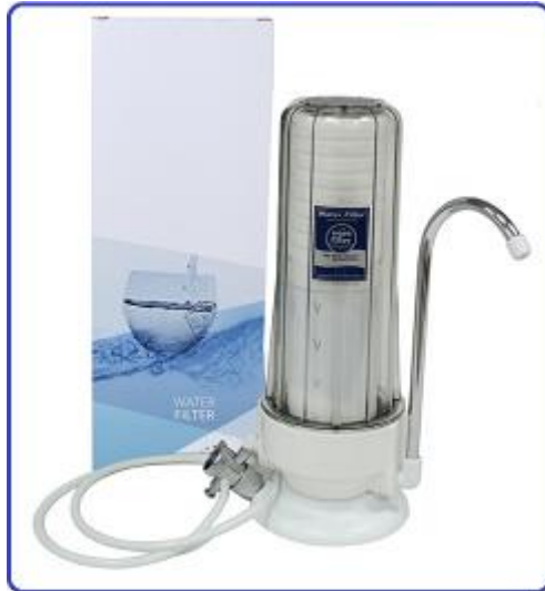
1. ábra - a kicsomagolt készülék