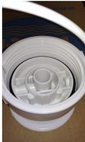
2. ábra - a készülék talpa