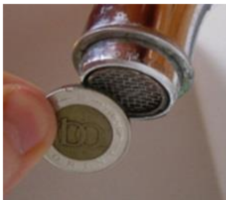
22. ábra - a perlátor a csap végén

Ezután a konyhai csap végéből ki kell tekernünk az ún. perlátort. Ez akkora, mint egy 100 Ft-os érme ( 22. ábra ). Kicsavarásához esetleg szükség lehet egy kombinált fogóra is ( 23. ábra ). A kicsavarást az óramutató járásával ellentétes irányban végezzük. Erre a perlátorra nem lesz szüksége, de őrizze meg, mivel a csap tartozéka.