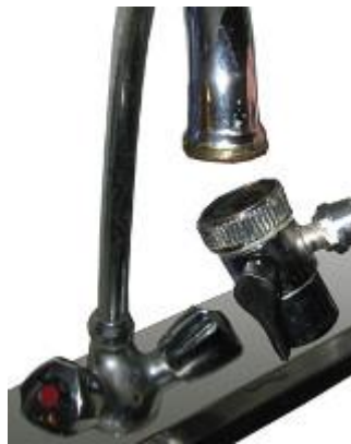
19. ábra - a szelep felhelyezése