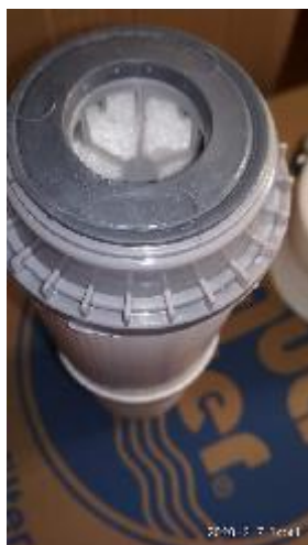
7. ábra - a szűrőbetét tömítése helyesen

Ha letelt az 1-2 óra (az sem baj, ha több), akkor a szűrőbetét alján található tömítőgyűrűt igazítsa vissza a helyére a betétbe, ahogyan az a 7. ábrán látható, ha netán nem lenne úgy. Ez után helyezze a szűrőbetétet az előző részben írtak szerint már elmosott készülékház talpába a 6. ábra szerint úgy, hogy a fekete végével lefele álljon és a tömítőgyűrű is a helyén legyen. (Fordítva szerelve nem szűr és kellemetlen ízű vizet ad!) Megfelelő behelyezés esetén a készülékház alján, középen található rövid cső és a szűrőbetétben található nyílás pontosan egymásba illeszkednek ( 6. ábra ).